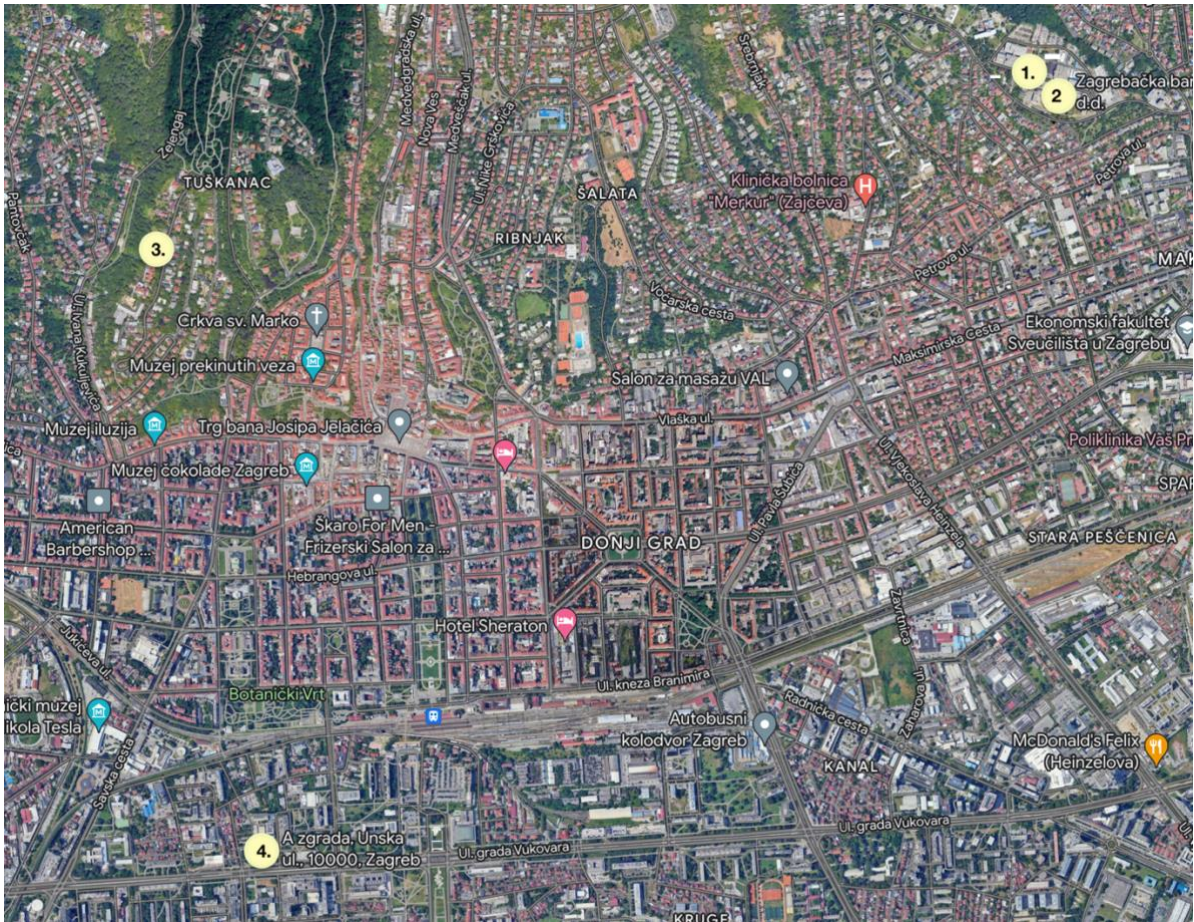
Karta 1. Položaji Pod-Projekata 1-4 u Zagrebu